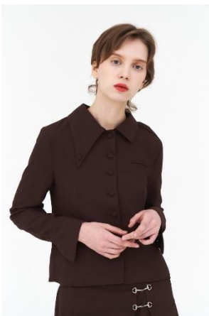
상품명: two-piece look (JK)