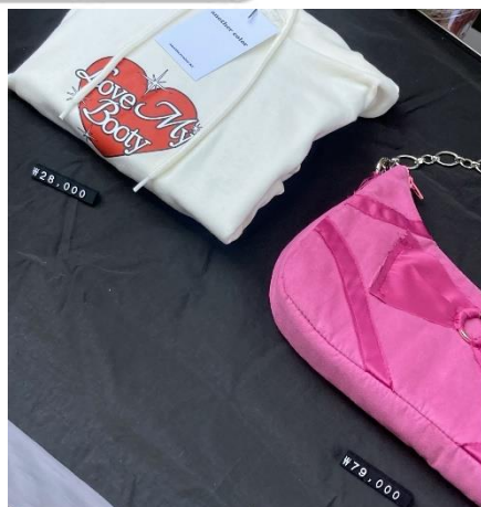
VMD 연출용 테이블