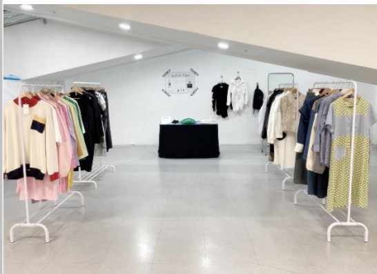
매대 대용 테이블