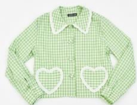
상품명: CHECK SHIRTING SK