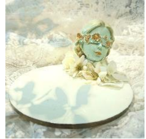
‘맨 왼쪽부터, 1. 보틀(bottle) 아트 2. 마블 레진트레이 3. 원목 행잉오브제 4. 실크 플라워 자개모빌 5. 패브릭 악세서리 거치대 6. 레진 오브제 트레이

‘Rinae’의 리빙데코 오브제들은 패션라인과 마찬가지로 브리티쉬 빈티지와 로맨틱 엘레강스의 컨셉을 베이스로,