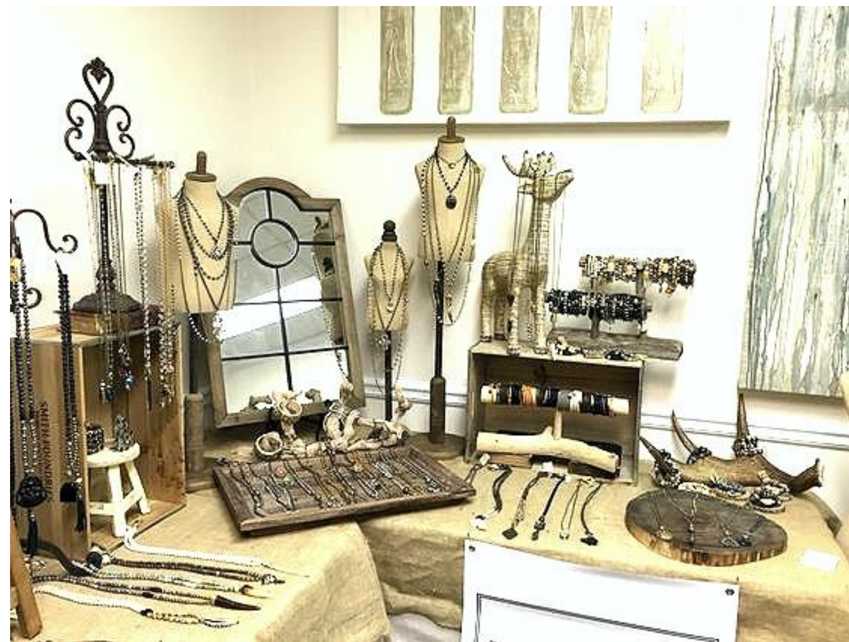
2004 런던 브릭레인 Spitalfields market 작가 활동