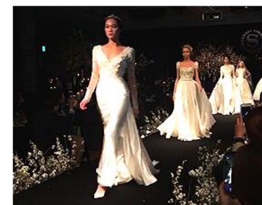
에일린꾸뛰르 2015 트렁크 쇼, 2016년 웨라톤호텔 웨딩쇼 제품협찬 및 스타일 디렉팅