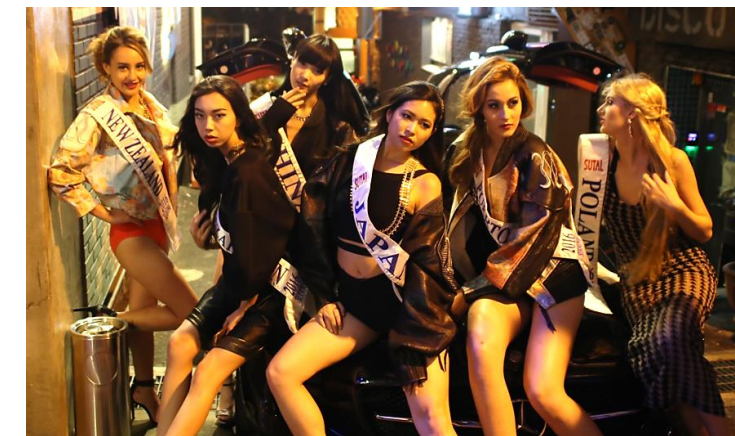
글로벌 파티행사 마퀴 행사 제품협찬 및 스타일 디렉팅