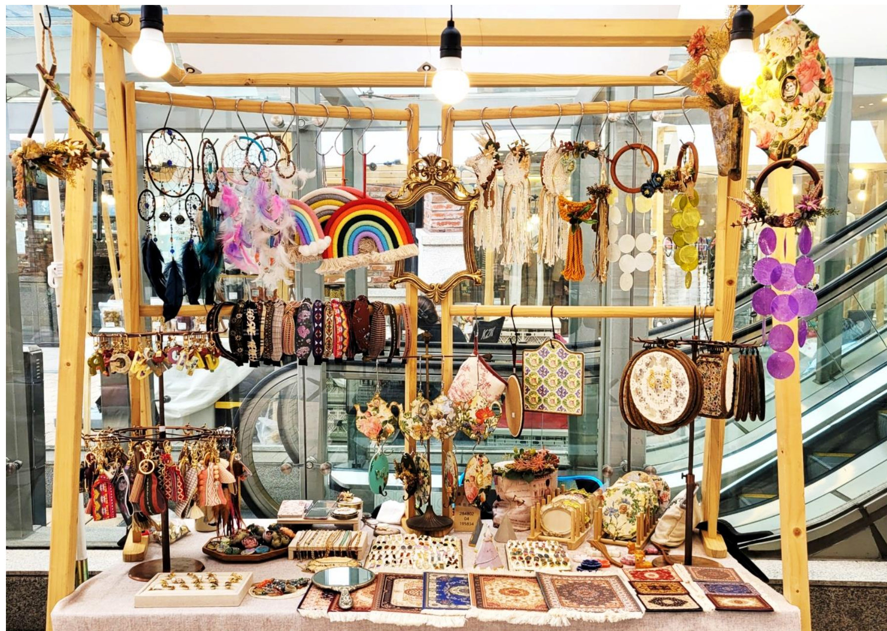
2022~24년 안녕 인사동 마켓 행사