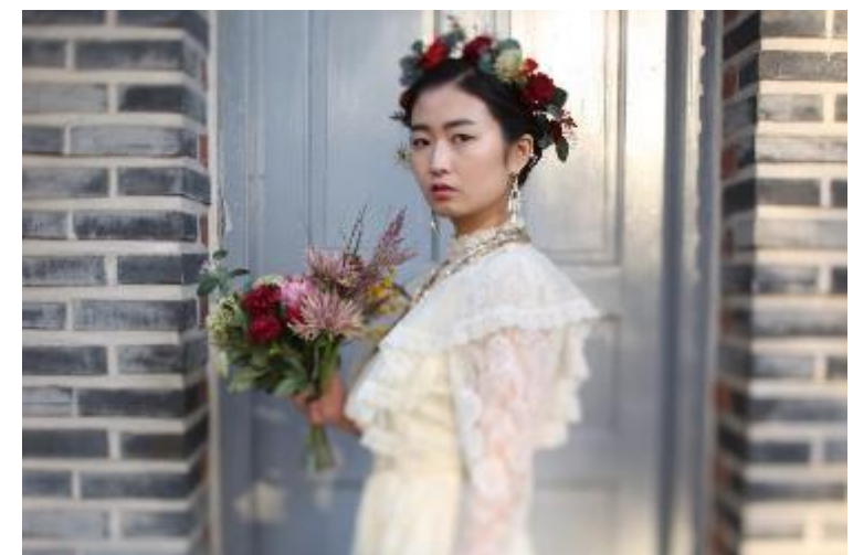
디자이너/작가 아트화보 콜라보레이션 제품 협찬 및 아트디렉팅