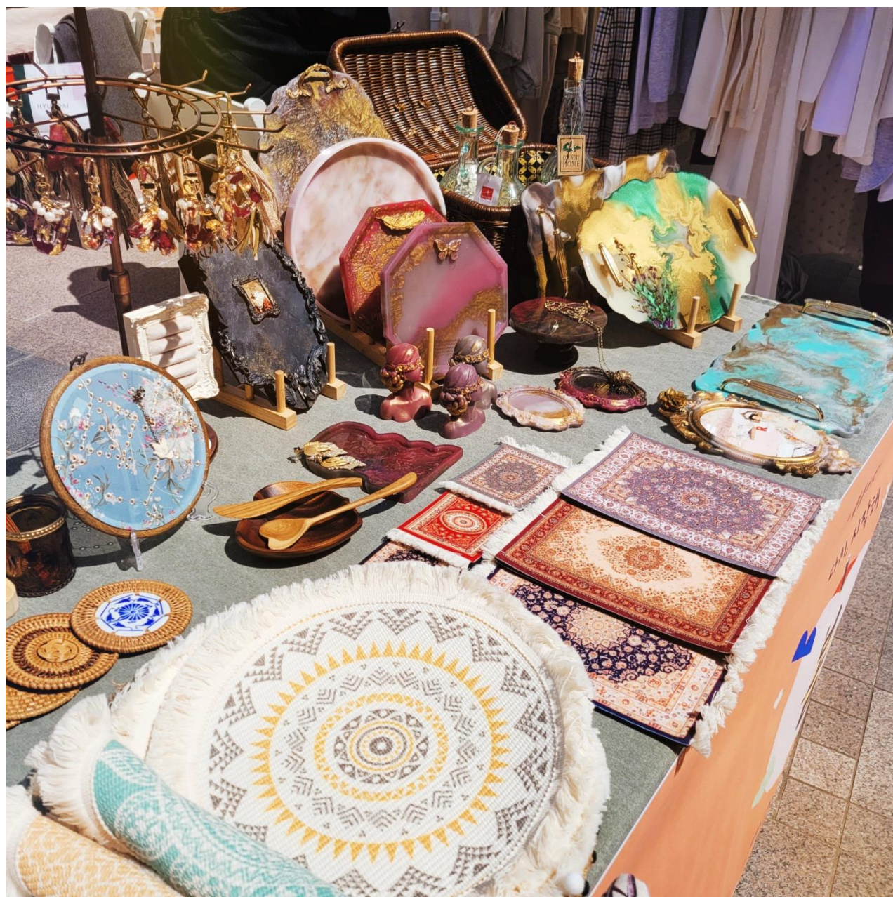
2021년 광고엘리웨이 마켓행사