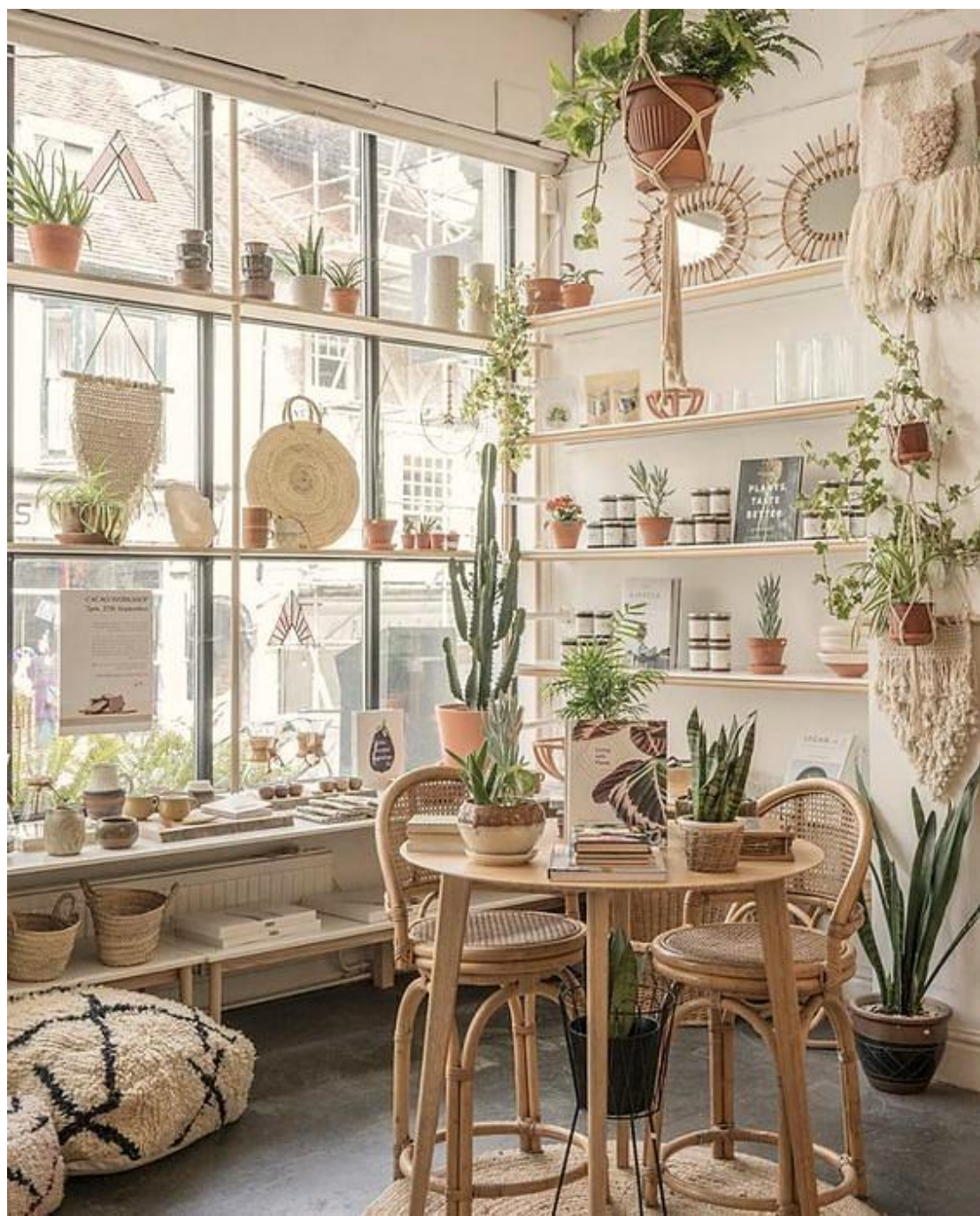
2010년 런던 브릭레인 'Cottage garden' 입점