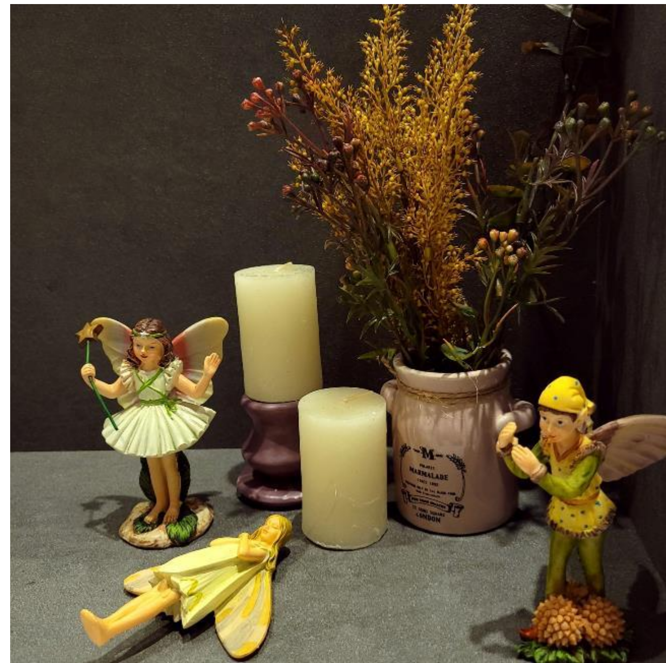
2022년 부산 롯데 백화점 서면점 편집샵 입점