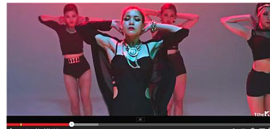
뮤지션 Nop. K 제품협찬 및 스타일링