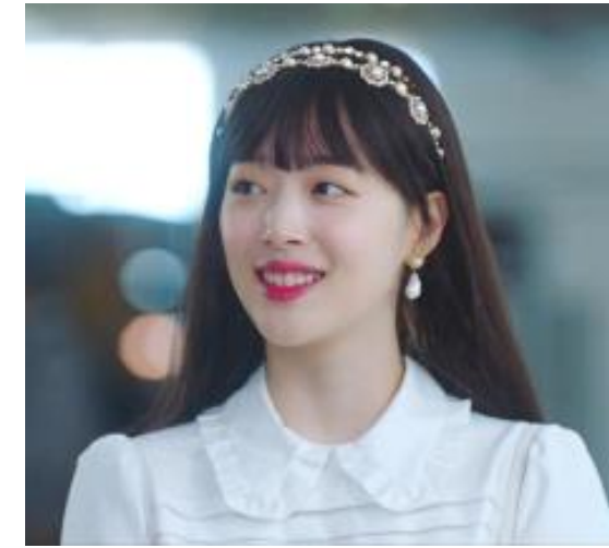
호텔 델루나 드라마 아이유/설리 협찬