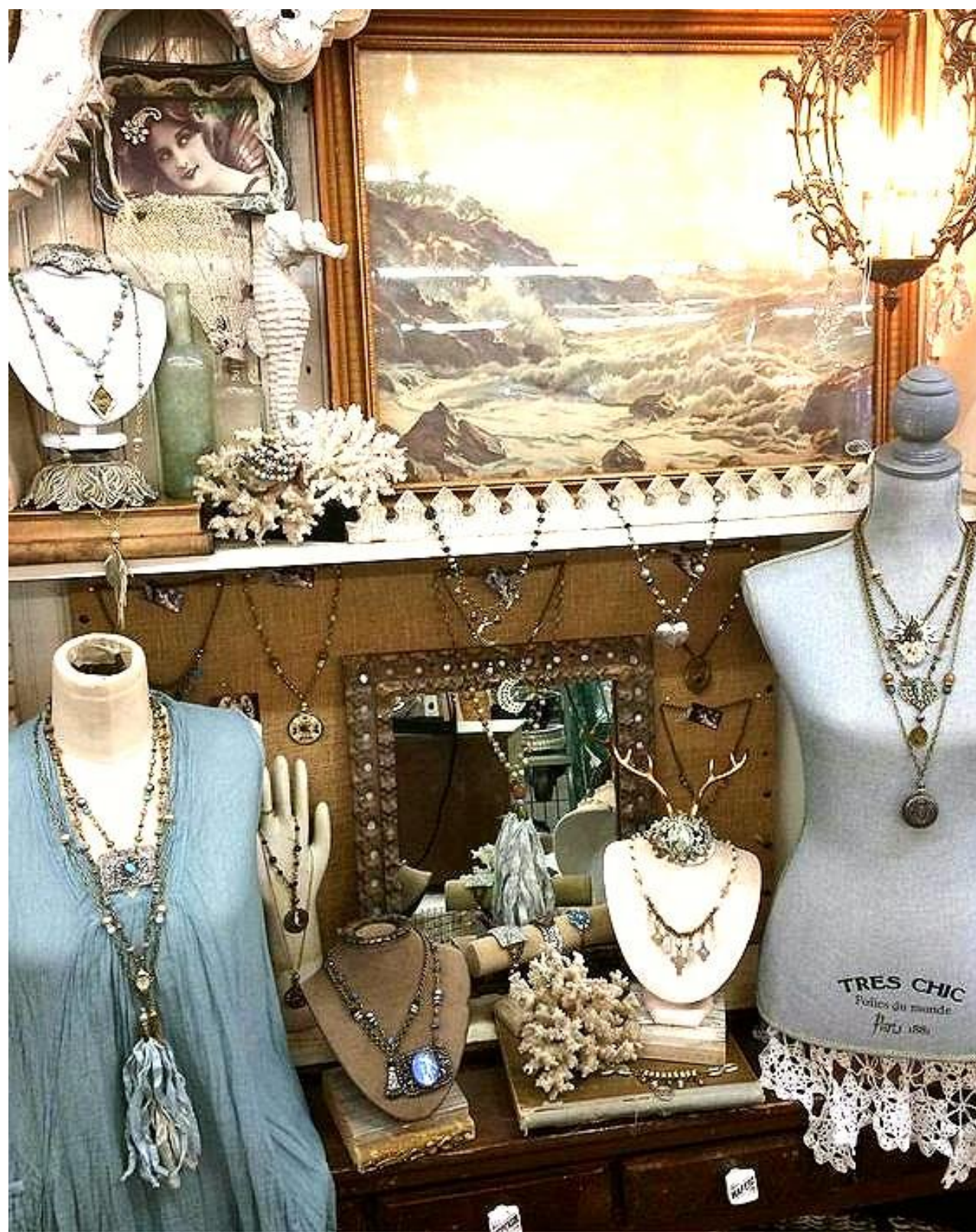
2009 런던 코벤트가든 Delectable mountain cloth 편집샵 입점