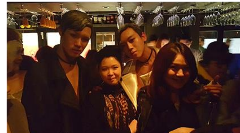
아방가르드 패션 파티 제품협찬 및 스타일 디렉팅