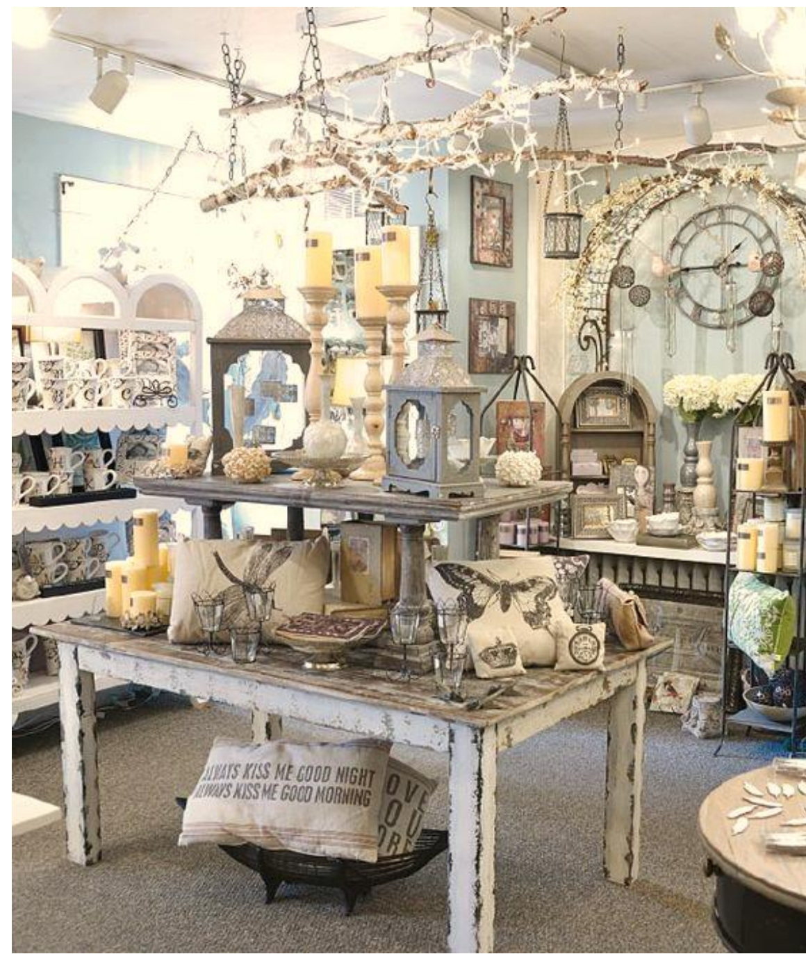
2023년 런던 'De nouvillere' 팝업스토어