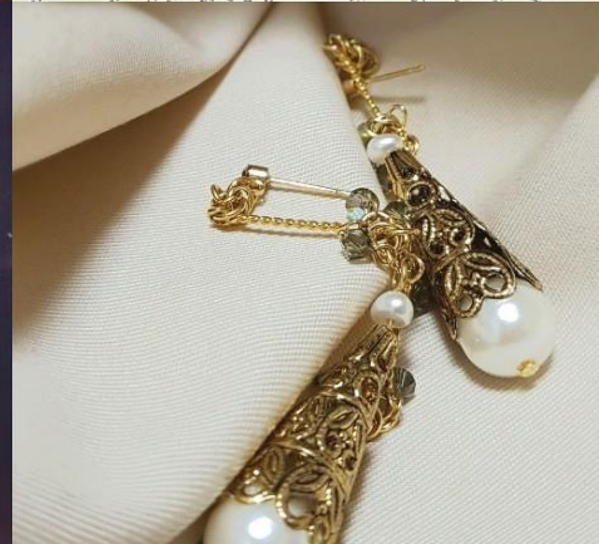
2018 로맨틱 빈티지 주얼리 시리즈