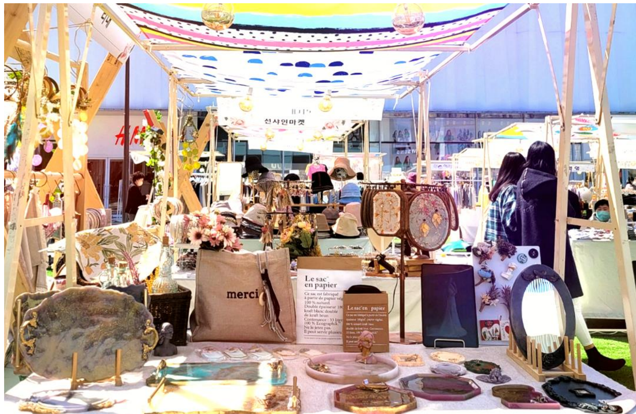
2021년 송도 프리미엄 아울렛 야외 팝업스토어 행사