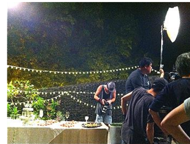
웹드라마 '고결한 그대' 인테리어 소품 협찬 및 테이블 스타일링