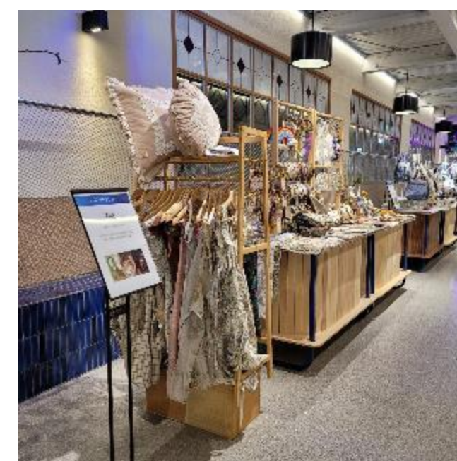
2022년 신세계백화점 영등포 점 디자이너브랜드 팝업스토어