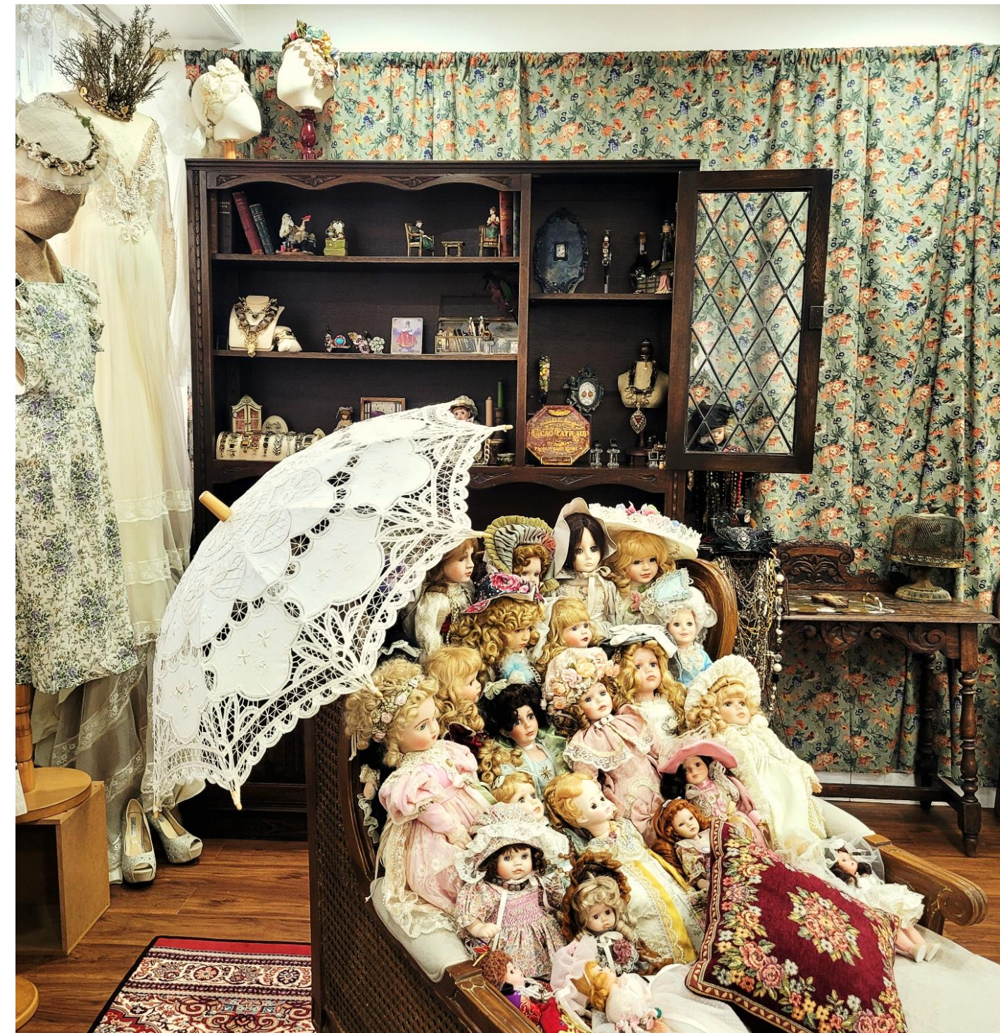
2024년 아뜰리에 리네 쇼 룸/작업실 전경