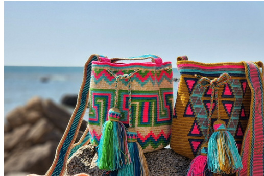
Mochilas Wayuu | 와유 모칠라백

Handmade woven bags, made in Colombia Price: ₩90,000 ~ ₩230,000