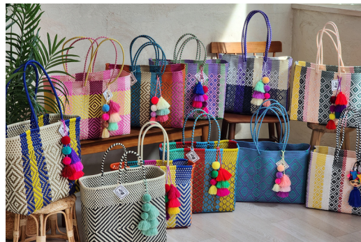
Recycled plastic bag | 재생플라스틱백

Handmade basket bags with recycled plastics, made in Mexico Price : ₩99,000 ~ ₩159,000