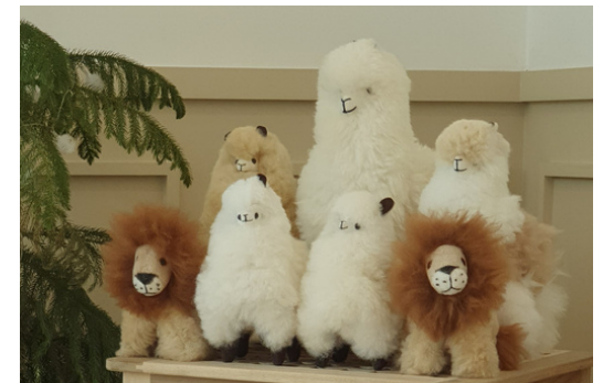
Alpaca fur dolls | 알파카 퍼 인형

Handmade basket bags with recycled plastics, made in Mexico Price : ₩99,000 ~ ₩159,000