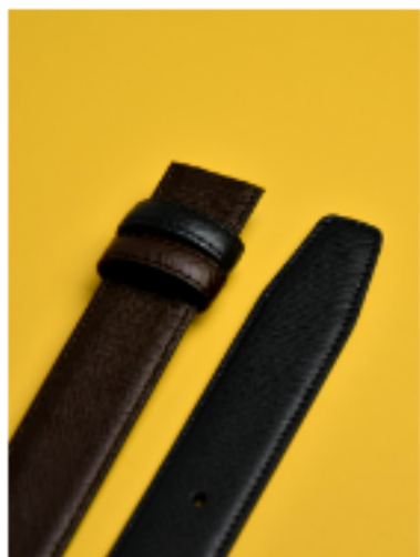
사피아노 블랙 브라운 블랙/브라운 120x3cm FKR10