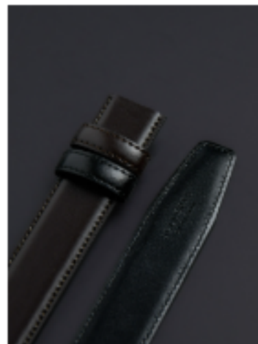
다크브라운 브라운/블랙 120x3cm FKR11