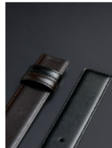
스퀘어팁 블랙/브라운 120x3.5cm FKR05