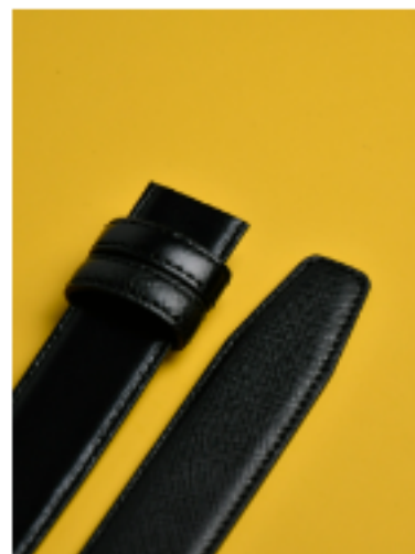
사피아노 콤보 블랙/블랙 120x3cm FKR31