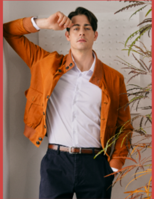
이벤트 결혼식, 여행, 데이트