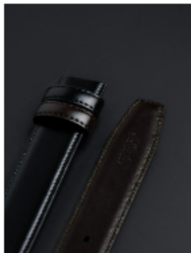
V팁 블랙/브라운 120x3cm FKR01