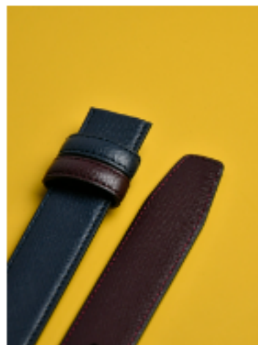
사피아노 네이비 버건디 네이비 버건디 120x3cm FKR18