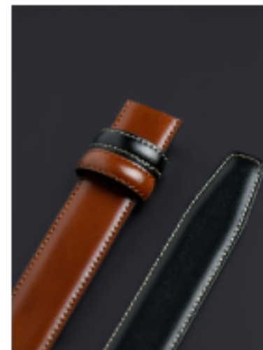
뉴세들 탄브라운/블랙 120x3cm FKR41