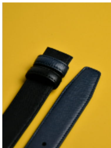
사피아노 블루 블랙 블루/블랙 120x3cm FKR03