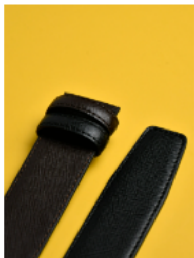
사피아노 블랙 브라운 블랙/브라운 120x3.5cm FKR16