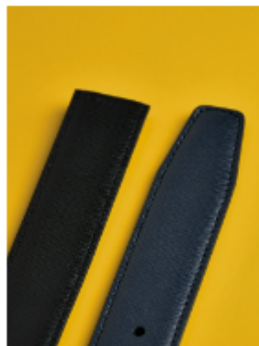
사피아노 블랙 블루 블랙/블루 120x3.5cm FKR48