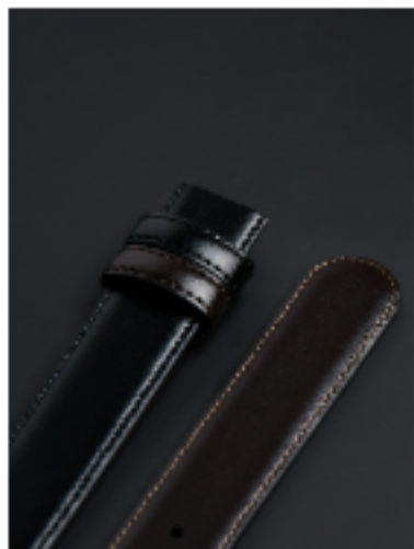
U팁 블랙/브라운 120x3cm FKR02