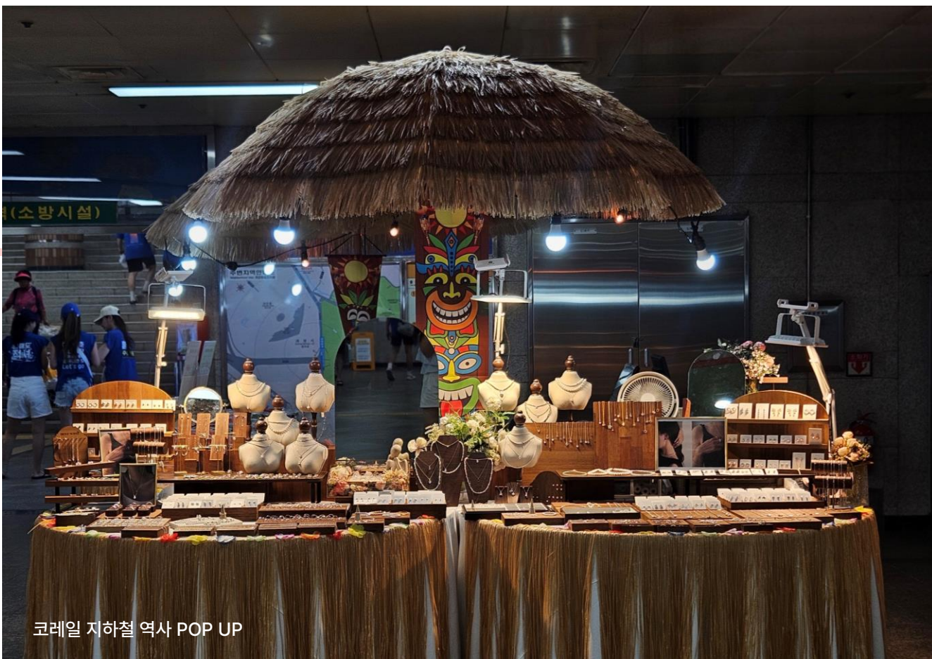
코레일 지하철 역사 POP UP