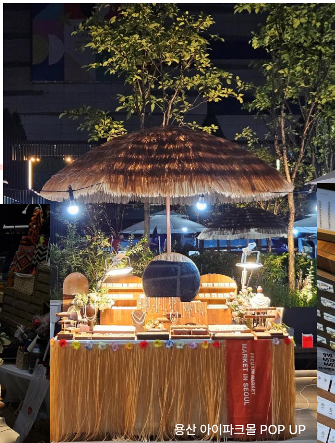
용산 아이파크몰 POP UP