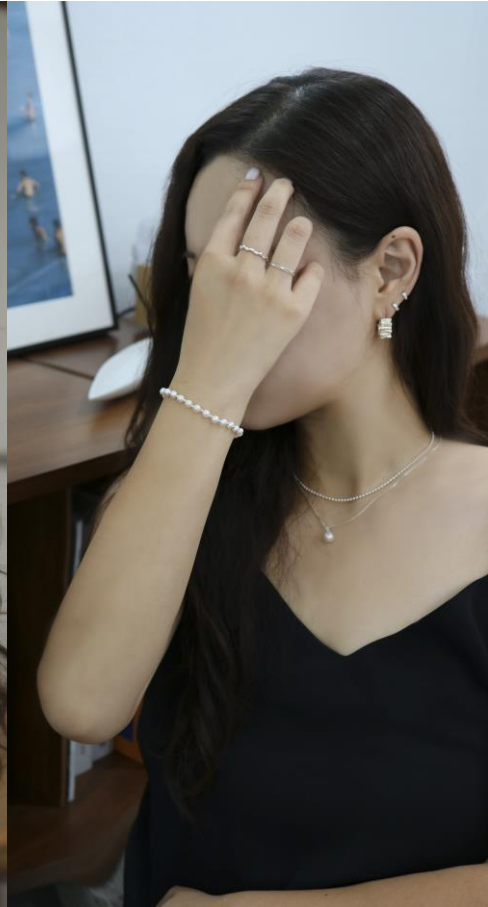
조약돌 실버 반지 30000원