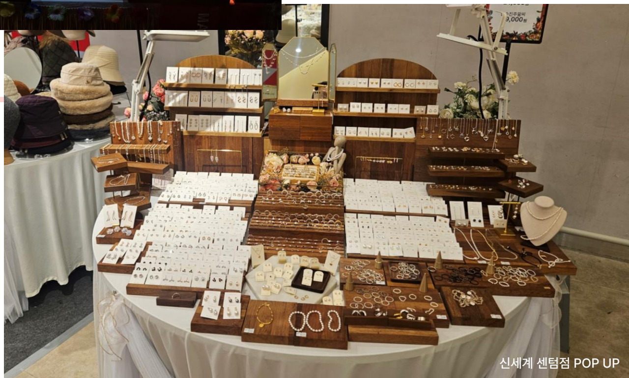
신세계 센텀점 POP UP