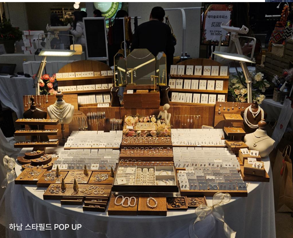
하남 스타필드 POP UP