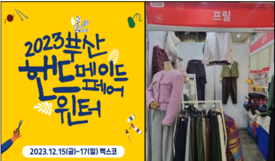
2023 핸드메이드페어 윈터