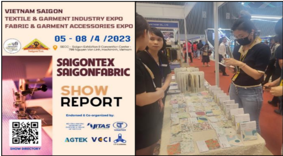
2023 베트남 호치민 패브릭 엑스포