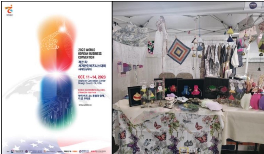
2023 미국 세계 한상대회