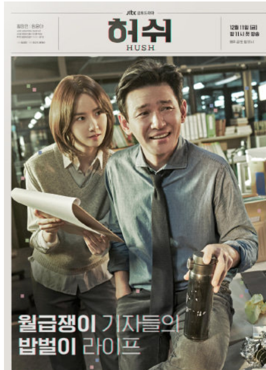
2020 jtbc <허쉬> <허쉬> 코지앤코지 침구가 함께 합니다!