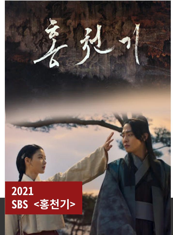
2021 SBS <홍천기>