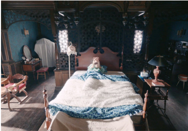
2020 tvN <사이코지만 괜찮아>

온고잉 상품은 물론 드라마를 위한 별도의 제품을 디자인하여 방송 매체에 협찬하고 있습니다.