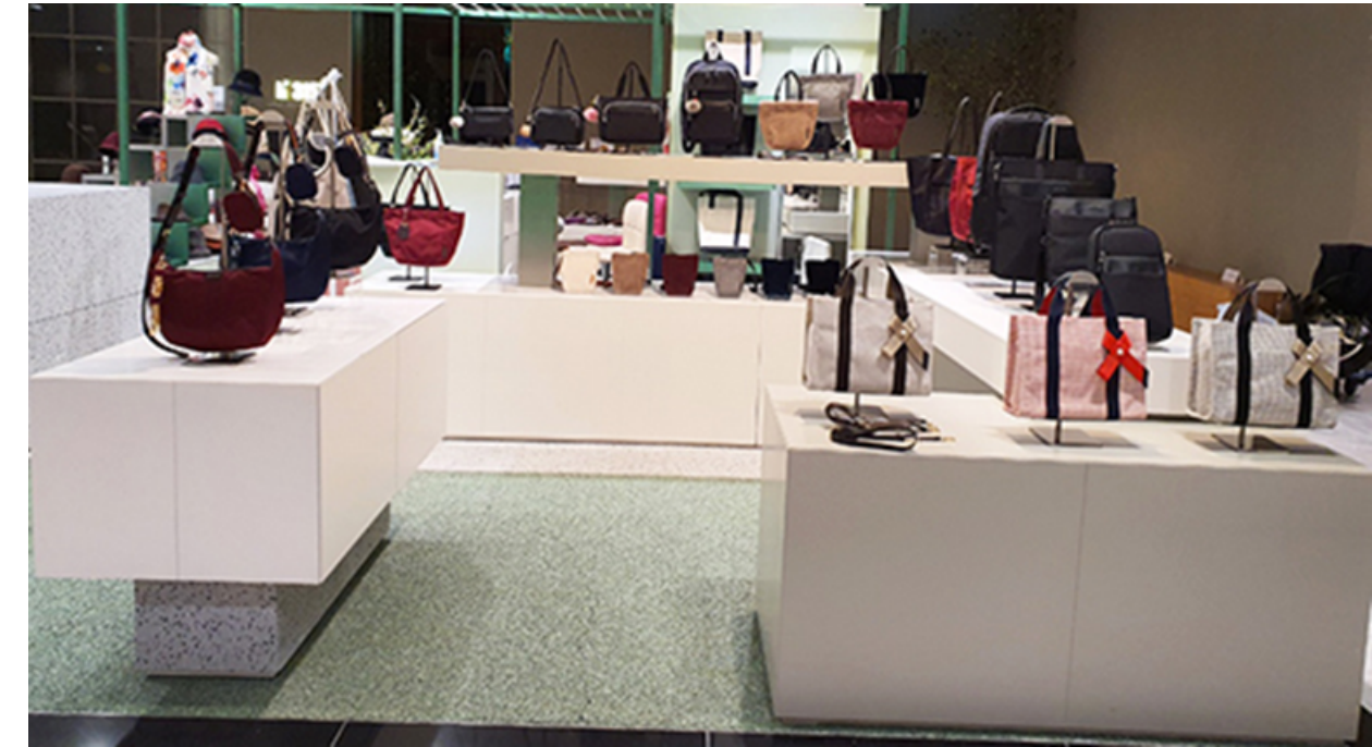
현대백화점 POP-UP STORE (2021년 10월 19일~11월 14일)