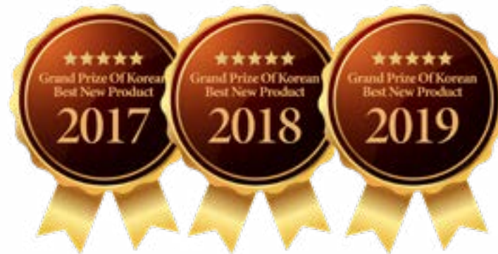
중소기업부 한국일보 한국브랜드협회 3년 연속 베스트신상품 대상 수상