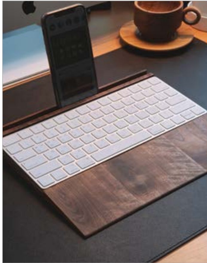
Moowood - 우드 오피스/데스크 제품