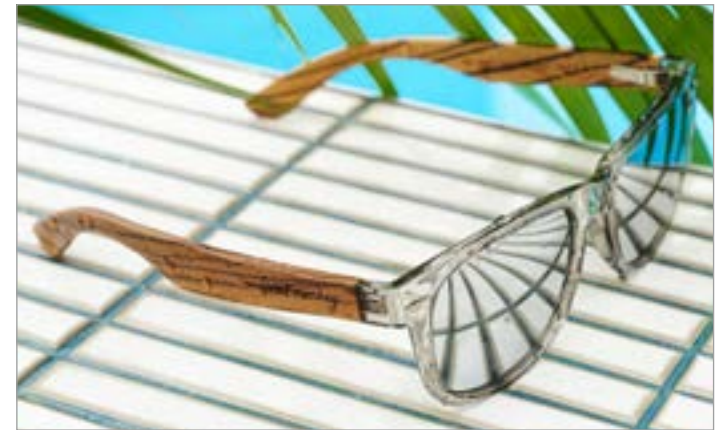
Saint Monkey - 우드 섀글라스