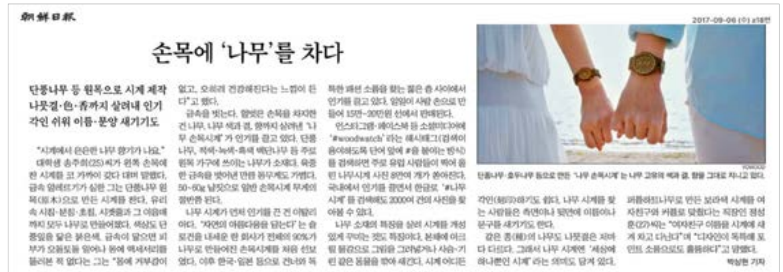
조선일보 기사 수록