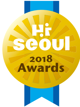
Hi seoul award