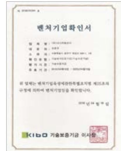
벤처기업 인증 (인증일 : 2018년 4월 16일)