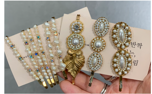
2. 담수진주 헤어핀 10,000~18,000원