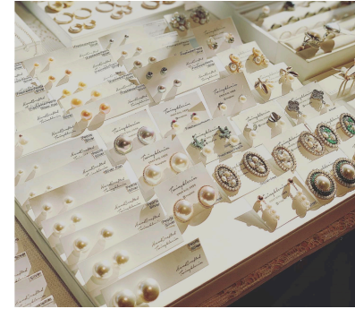
2. 담수진주 실버귀걸이 15,000 ~ 55000원