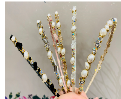
6. 진주헤어밴드 34,000원