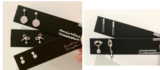
3. 실버 귀걸이 19,000 ~ 69,000원