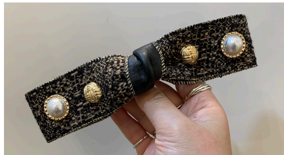
5. 헤어핀 15,000 ~ 45,000