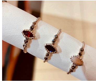
1. 실버원석반지 39,000원