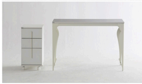
매대 대용 테이블