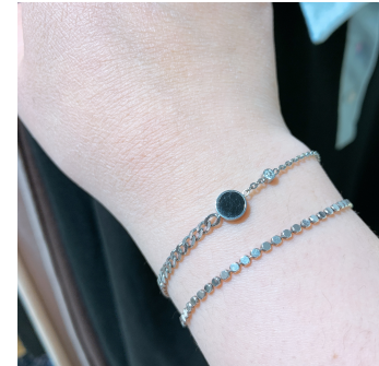
4. . 써지컬 오닉스 팔찌 29,000원