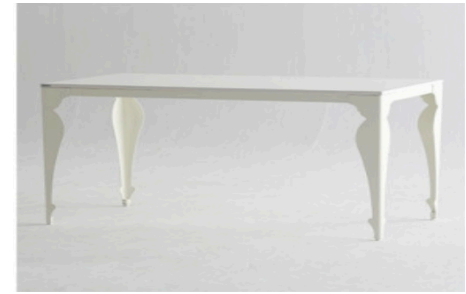
매대 대용 테이블2