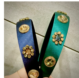
6. 크리스탈헤어밴드 94,000원