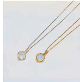
3. 실버 (원석) 목걸이 39,000 ~ 139,000원