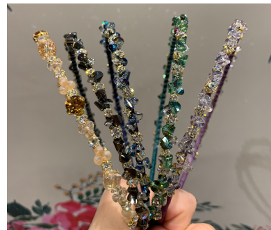
5. 크리스탈 헤어밴드 29,000원