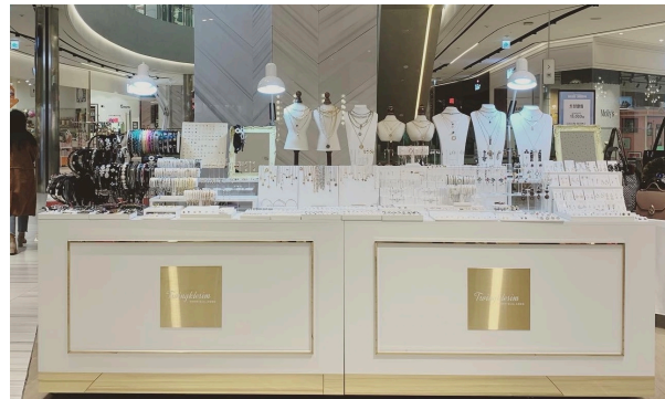
VMD 연출용 집기