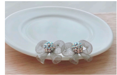
TwinkleRim Mesh Ribbon Earrings