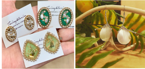
1. 담수진주/자개 귀걸이 32,000/49,000원