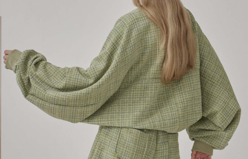
moiremoa 2022 fall collection tweed bolero cardigan