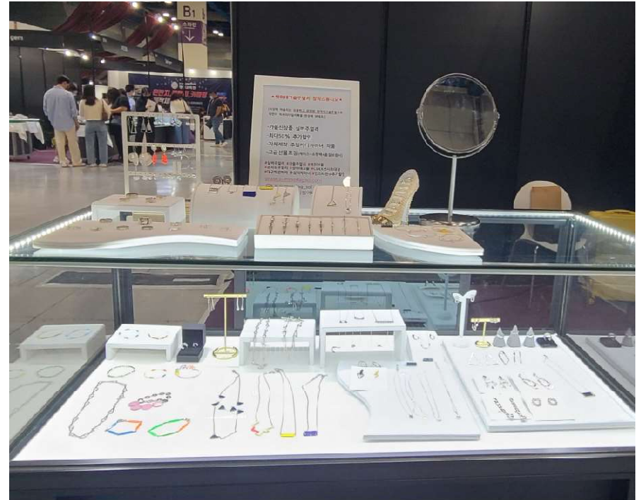
MOST 2022 서울국제주얼리&악세사리쇼(2022년9월 COEX)