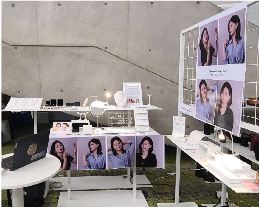
2023 FW 패션코드 2023.3월 DDP