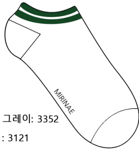
로고 그레이: 3352 백색 : 3121 그린 : 3230