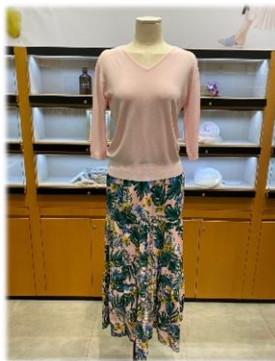
5. 상의 여름니트 티셔츠 : 39,000 원 하의 플라워 스커트 : 89,000 원