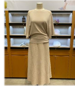
6. 여름 니트 투피스 119,000원