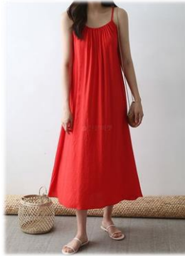
3. 나시 원피스 69,000원