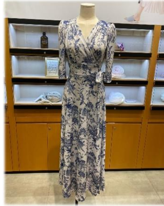
1. 램원피스 1 : 99,000원