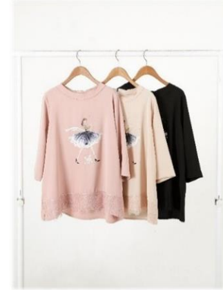
2. 프린트 티셔츠 2 : 79,000원