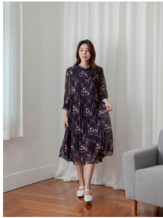
1. 주름 원피스 : 129,000원