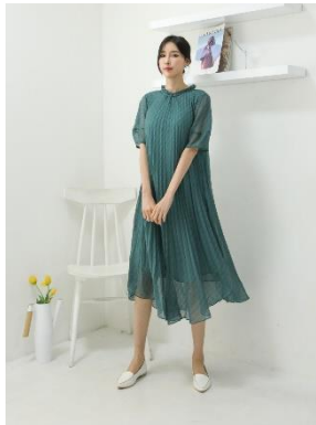
5. 플리츠 원피스 2 : 129,000원