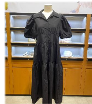
4. 프라다 셔츠 원피스: 99,000원