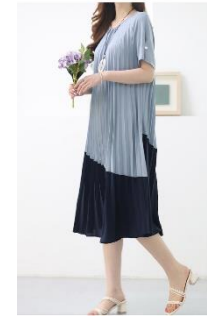
4. 투톤 주름 원피스 : 129,000원