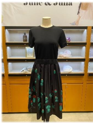
1. 선인장 니트 원피스 : 129,000원