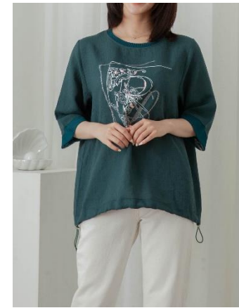
2. 프린트 티셔츠 : 69,000원