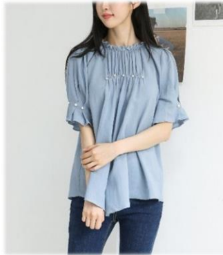
5. 진주 블라우스 : 79,000 원