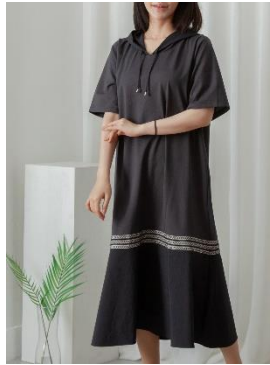
3. 후드 원피스 1 : 99,000원