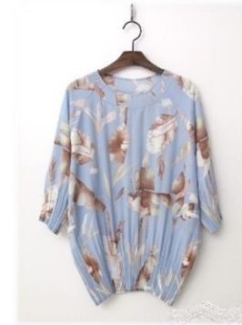
4. 쉬폰 플리츠 블라우스 2 79,000원