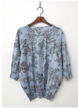
3. 쉬폰 플리츠 블라우스 1 79,000원