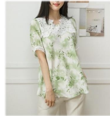
6. 플라워 블라우스 79,000원