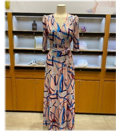
2. 램원피스 2 : 99,000원