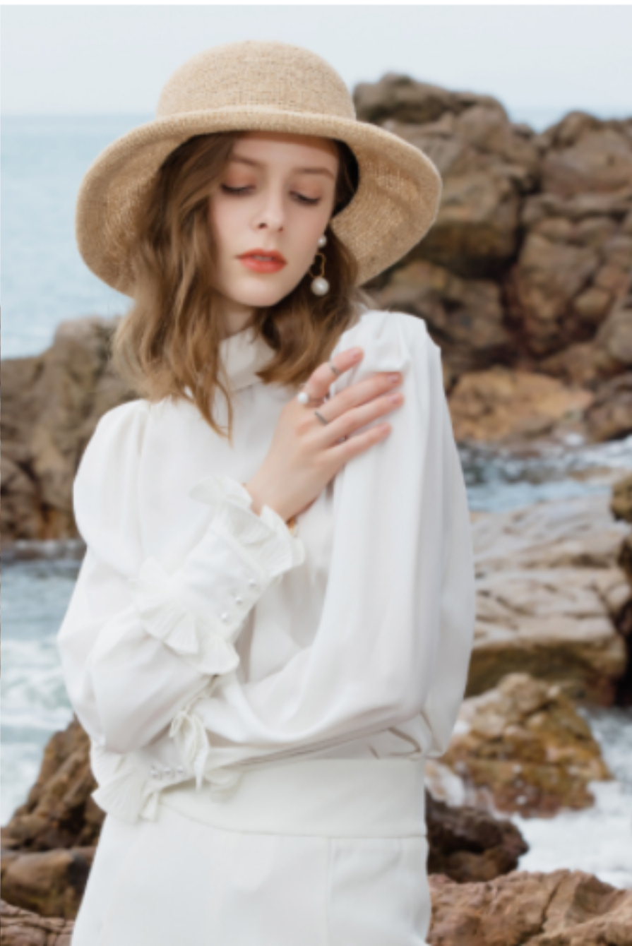
Special lady Hat