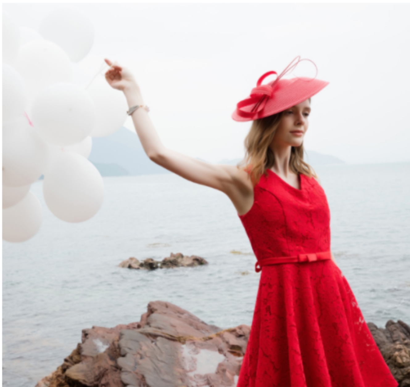
A lady's hat