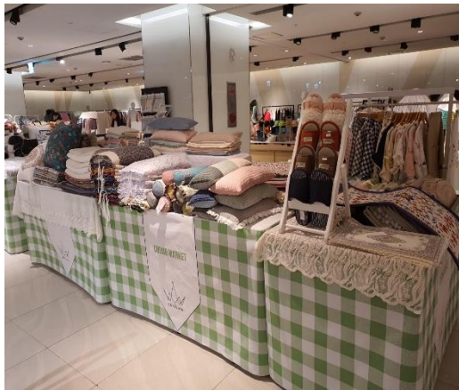
VMD 연출 시안3