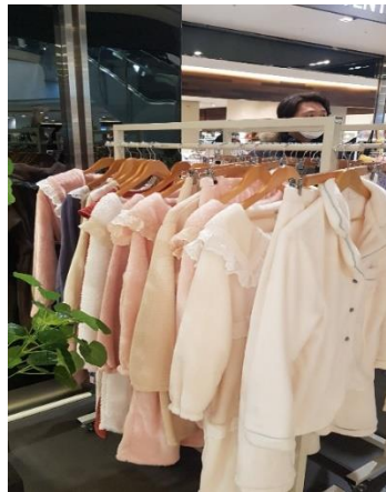
VMD 연출 시안4