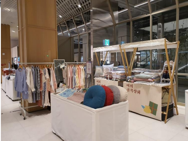
VMD 연출 시안1